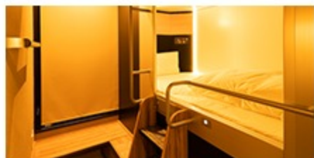
～キャビン・カプセル～