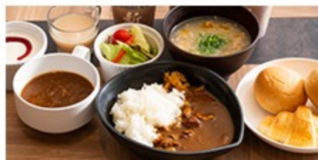
～レストラン・ドリンクコーナー～